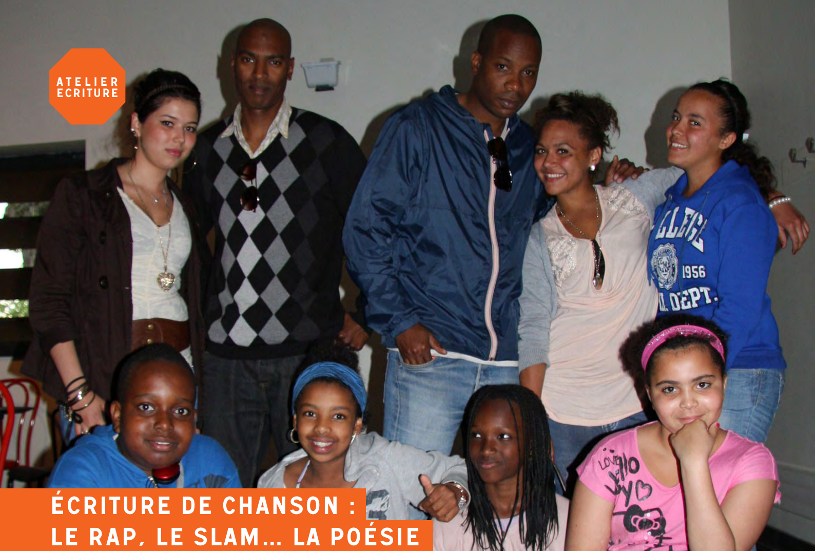
Atelier écriture avec le groupe de rap «La Rumeur» - 2011